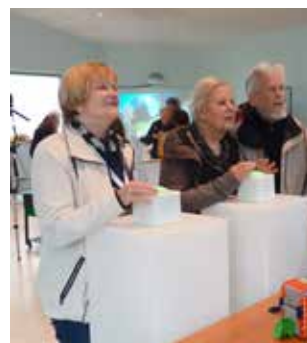
Journée portes ouvertes 1 er juin 2024