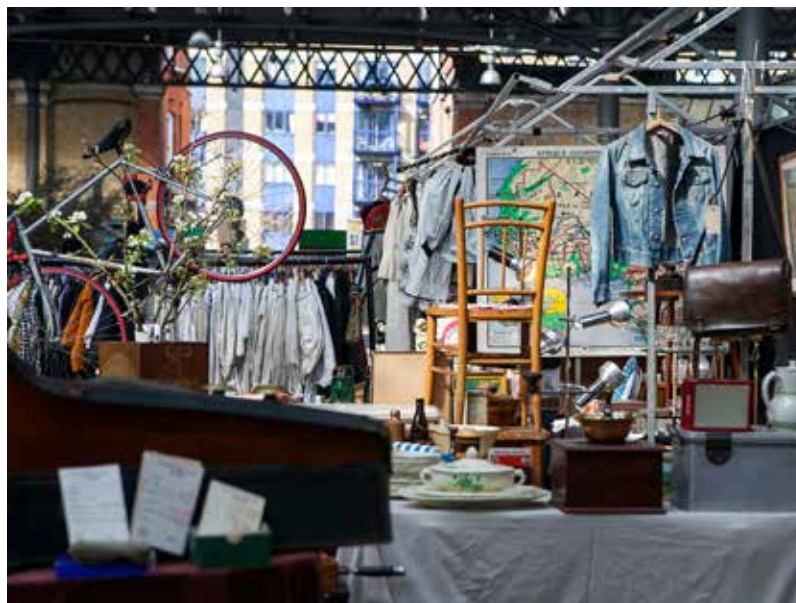
Zone de réemploi

En attendant cette ouverture, favorisons le don entre particuliers.