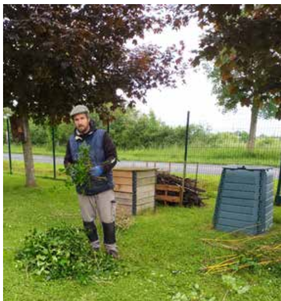
Atelier «gestion des végétaux au jardin»

Ateliers en accès libre sans inscription préalable