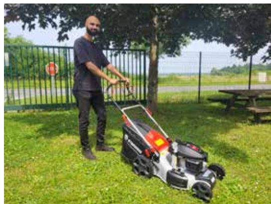
Notre grand gagnant et son lot