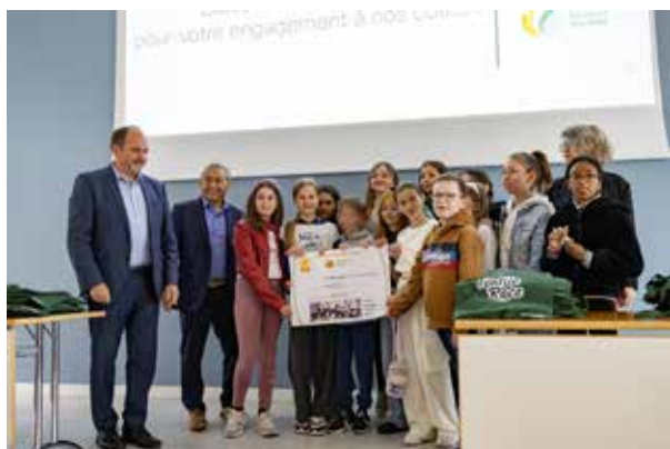
Remise des récompenses à la classe gagnante de la Textile Race

Le gagnant du jeu a mené parfaitement son enquête et remporté une tondeuse qui lui permettra de prendre soin de son jardin et d'avoir recours au mulching et au paillage.